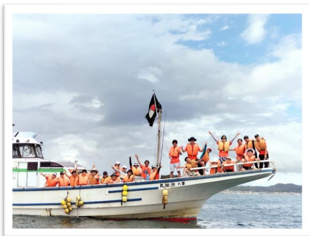
▲最終日、漁船から応援して下さるOBの先生方

最終結果は慶應義塾大学医学部が39ptで1位、千葉大学医学部は54ptで4位という結果になりました。