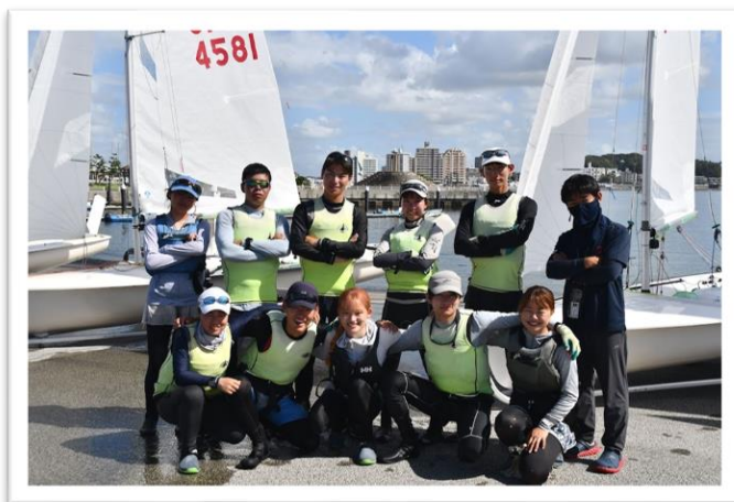
▲医科歯科レースメンバーとサポートメンバー