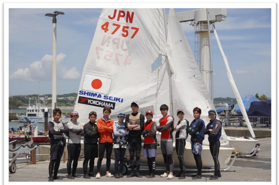
▲東医体レースメンバー