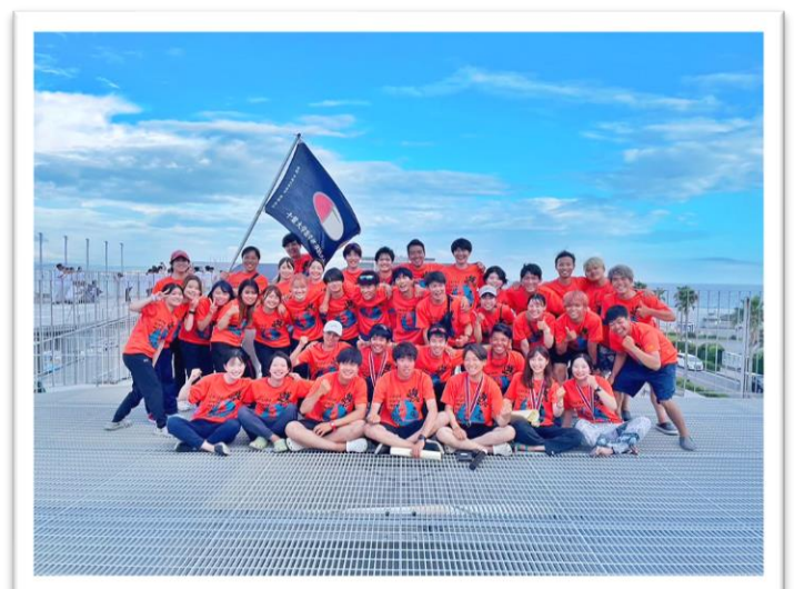
▲東医体後の部員集合写真