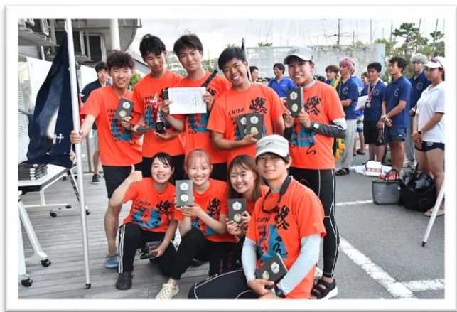
▲医科歯科大会後の集合写真